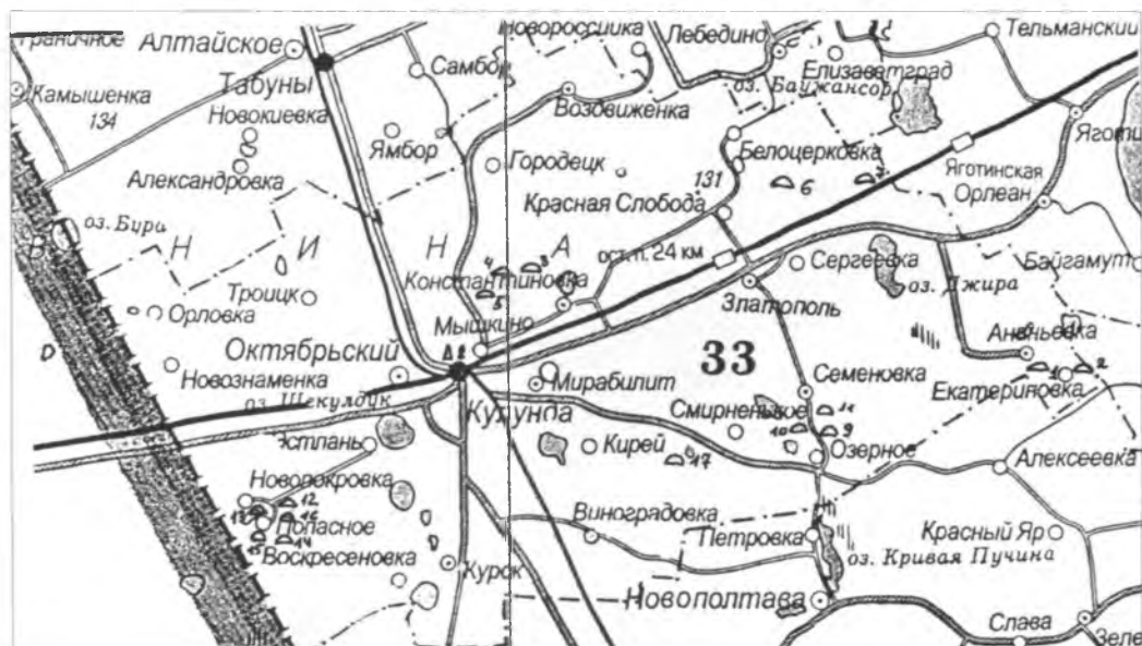
Рис. 1. Карта археологических памятников Кулундинского района

17. Смирненькое I. Курганная группа. Находится в 0,3 км к востоку от 39 км (от Кулунды) трассы с. Кулунда – с. Родино и в 4 км к западу от с. Смирненькое. Вдоль трассы проходят ЛЭП и лесополоса. Группа расположена вдоль грунтовой дороги, идущей с трассы в с. Виноградовка. Она состоит из четырех курганов, расположенных в цепочку по линии север-юг. На кургане № 4 установлен триангуляционный знак. Курганы граблены, имеют хорошо заметные ровики. Памятник открыт А.Б. Шамшиным в 1985 г. (Шамшин А.Б., 1986. С. 12).