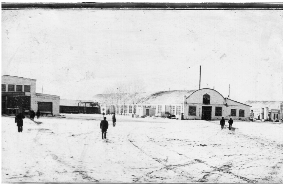
Фото 2. Цеха завода