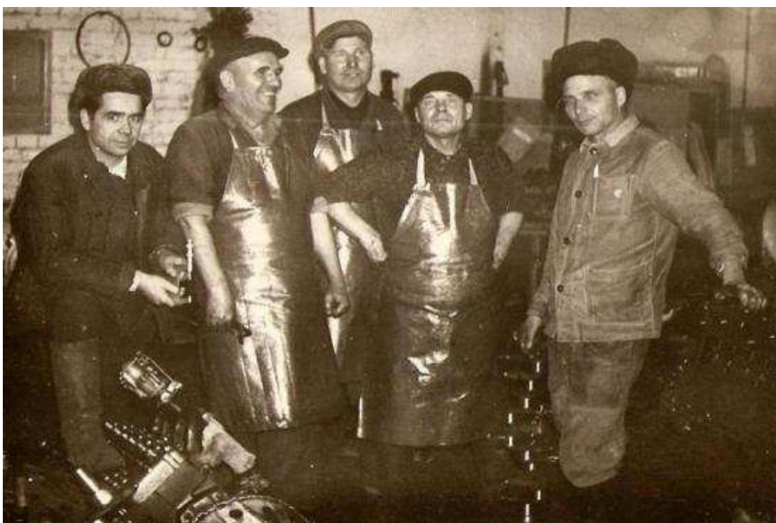
Фото 6. В будни и в праздники вместе.