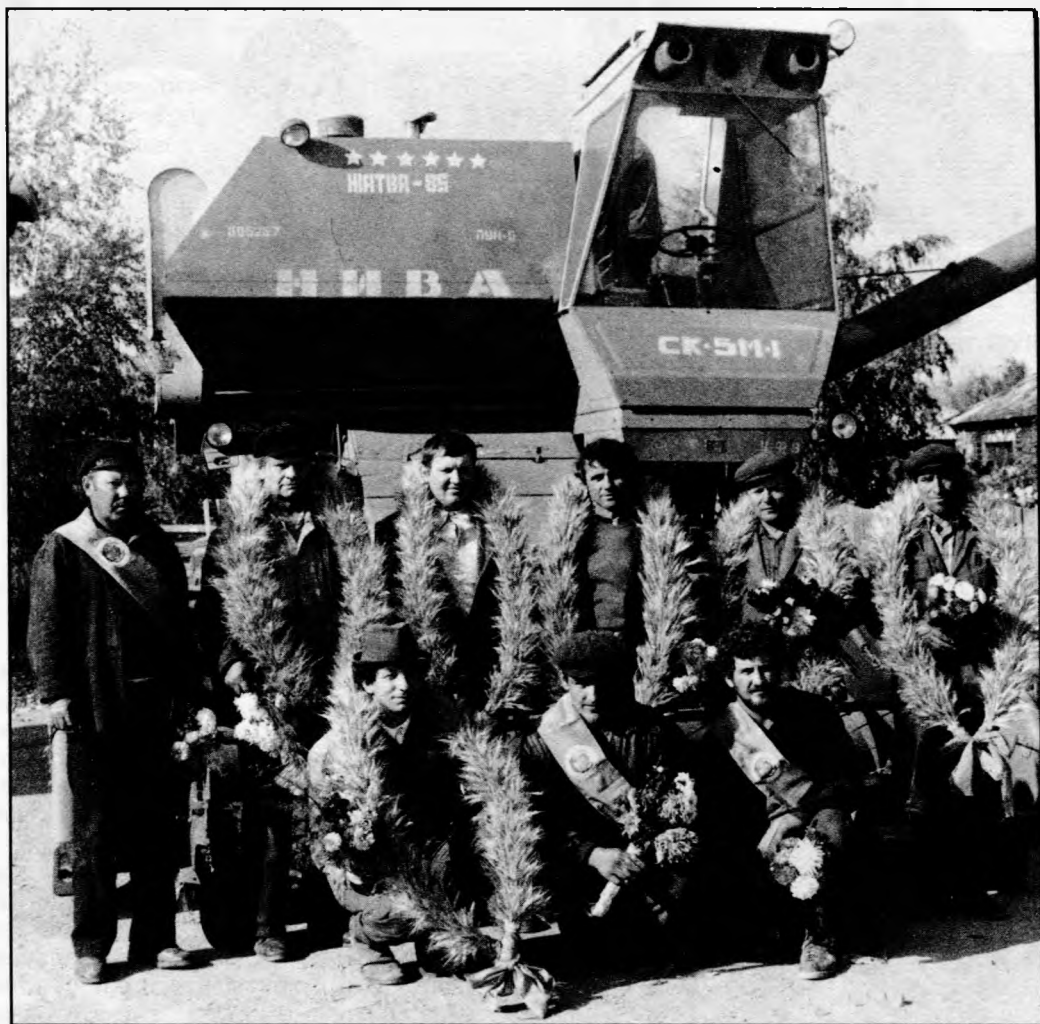
Победители «Жатвы-85». Поселок Целинный

ва (с. Северка) – 1290 га, им. Сталина (с. Ключи) – 200 га, «Слава» – 1450 га, «Победа» (Алексеевка) – 2947 га, им. Жданова (Новополтава) – 3846 га, им. Чкалова (Красный Яр) – 45 га, им. Ленина (Капи) – 2064 га, им. Калинина (Марковка) – 3083 га. В общей сложности землепользование первого совхоза тогда насчитывало 15980 га.