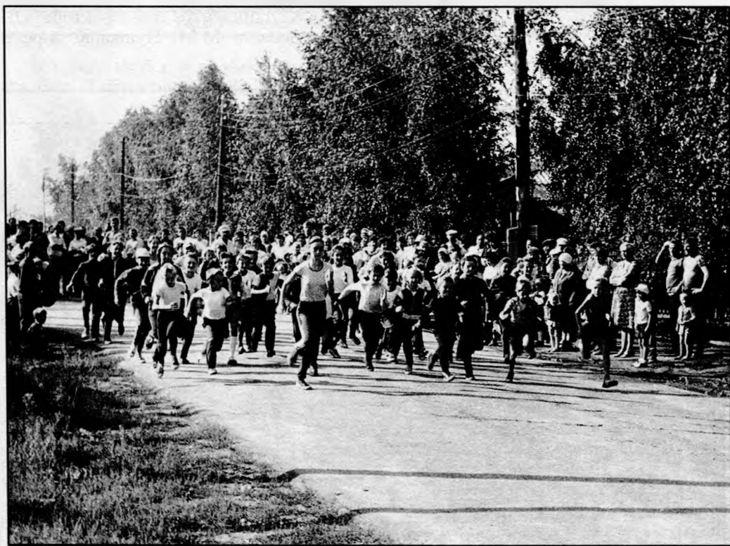
День физкультурника в поселке Целинном. 1986 год