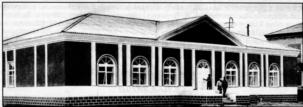
Дом торжеств в совхозе «Путиловский», с. Северка