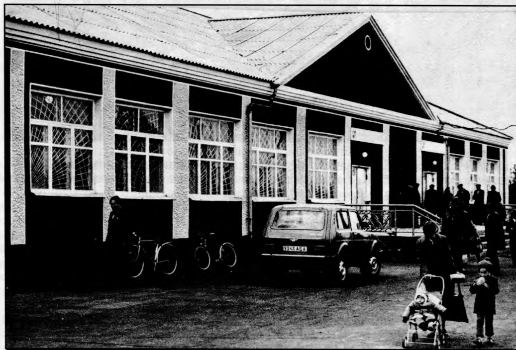
Торговый центр с. Северка