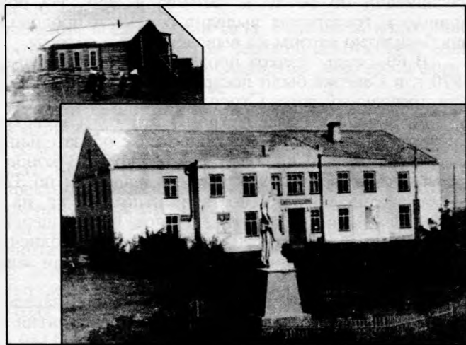
Старый клуб в с. Северка и новое здание Дома культуры, построенное в 1963 году

И тогда на общем собрании все, не верившие в идею застройки площади, принесли свои извинения. Тогда люди были насколько требовательными, настолько и снисходительными, умели требовать, но умели и признавать свои ошибки. Ощущалось какое-то общее взаимопонимание. Работали много и дружно. Отдыхали семьями и коллективами. Бедность, а затем улучшения жизни не отдельных личностей, а большинства людей сближали. Праздники проводились широко и дружно. Вечерами почти ежедневно, а в субботу и воскресенье на всех улицах до поздней ночи были слышны музыка и народные песни. Тесно между собой работали сельсовет, колхоз, школа и другие организации.