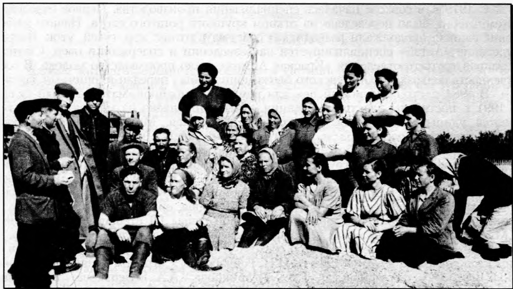
Мехток совхоза «Степной колос» во время уборки урожая. Село Каип, 1972 год

В 1976 г. открылся медпрофилакторий. В 1977 г. были построены новая баня, магазин, двухэтажное здание конторы. В период с 1978 по 1989 г. в селе ведется активное сооружение производственных объектов: строятся 4 новых коровника на 200 голов каждый, 5 новых кошар. В 1981 г. в отделении «Алтай» вводятся новый кормоцех по производству гранул, успешно работавший до 1995 г., новый автогараж на 60 автомобилей, столярный цех, 2 новых продовольственных склада на мехтоку.