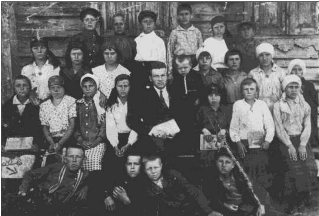
Рис. 2.4 Первый выпуск Ключевской начальной школы № 3. 1935 год.