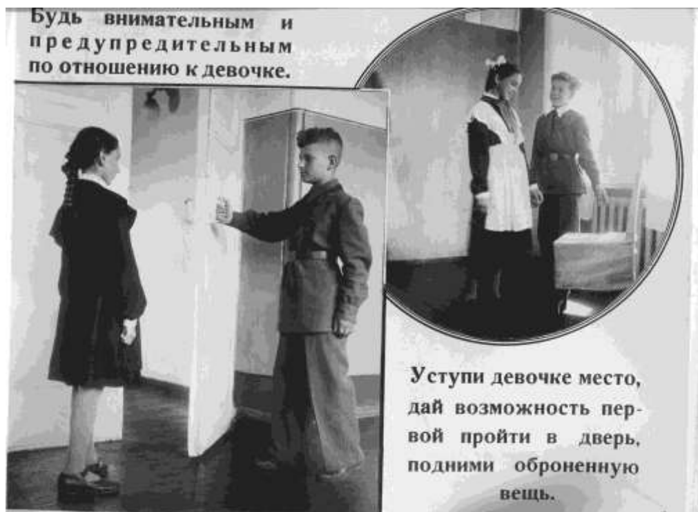
Рис.2.2 Правила поведения учащихся. Иллюстрация № 3. Источник: Ключевский краеведческий музей. О.Ф.1724.