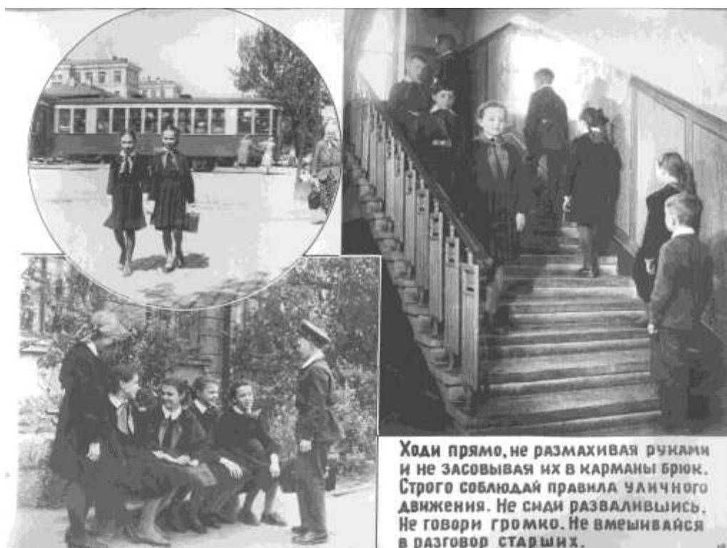
Рис.2.1. Правила поведения учащихся. Иллюстрация № 1. О.Ф.1724.